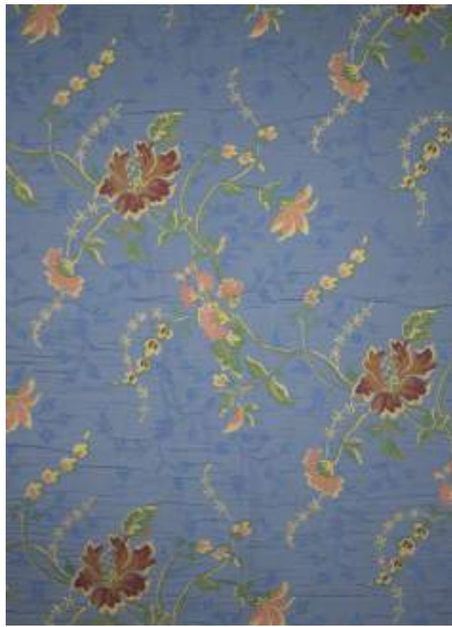
CR 2858 - BLU