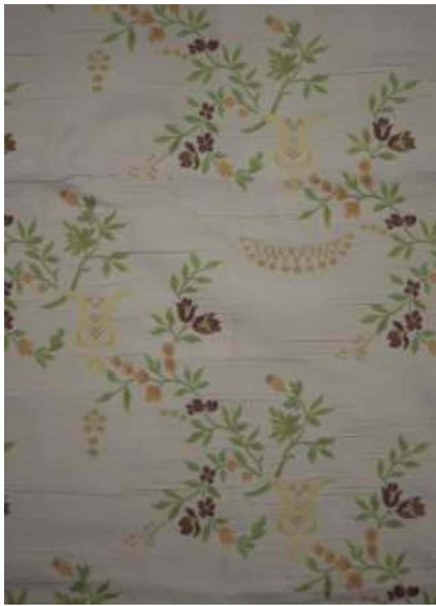
CR 2861 - BEIGE 4