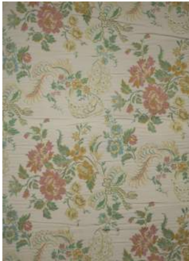
CR 2862 - BEIGE 5