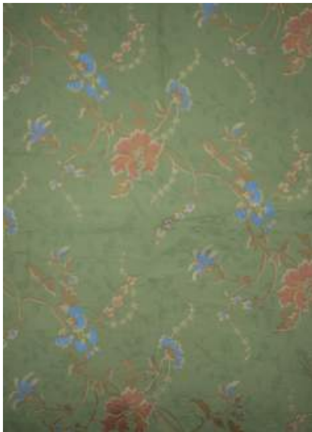
CR 2859 - VERDE