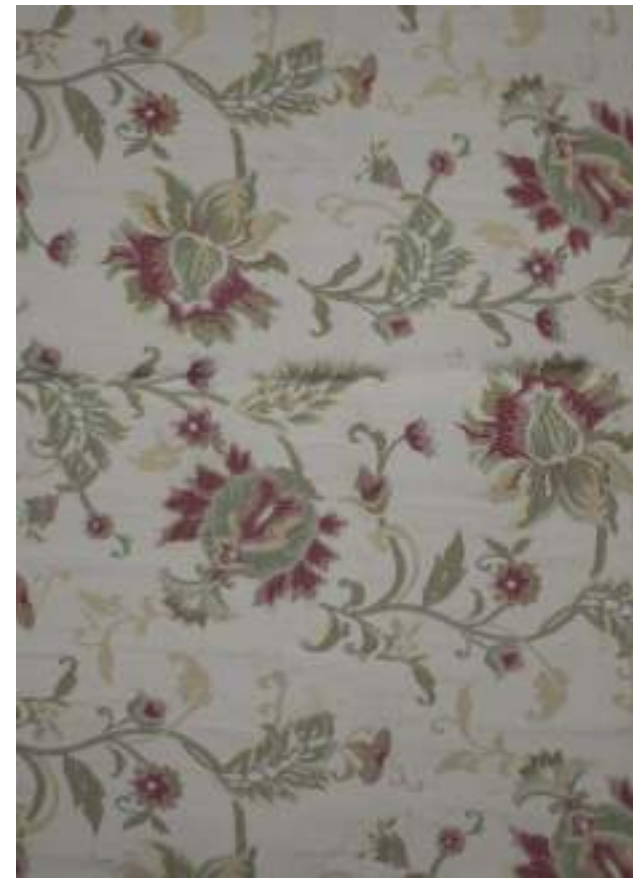
CR 2860 - BEIGE 3